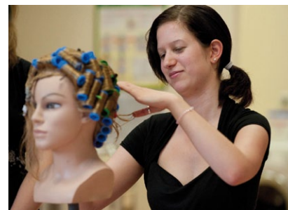
> Fachkraft Friseur/in